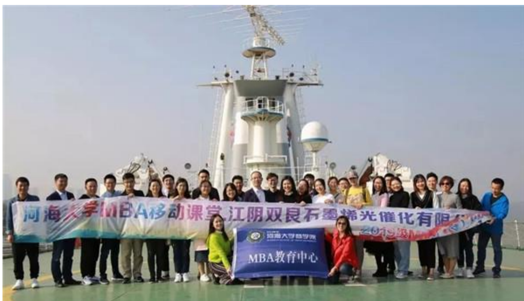
河海 MBA 移动课堂

河海大学为 MBA 学子们搭建了多种多样的交流平台，开展了形式多样的学习方式。丰富多彩的品牌活动成为同学们拓宽眼界的“第二课堂”，不但让大家在其中做到学有所悟，更能在实际的工作生活当中做到学以致用，与志同道合的同学、校