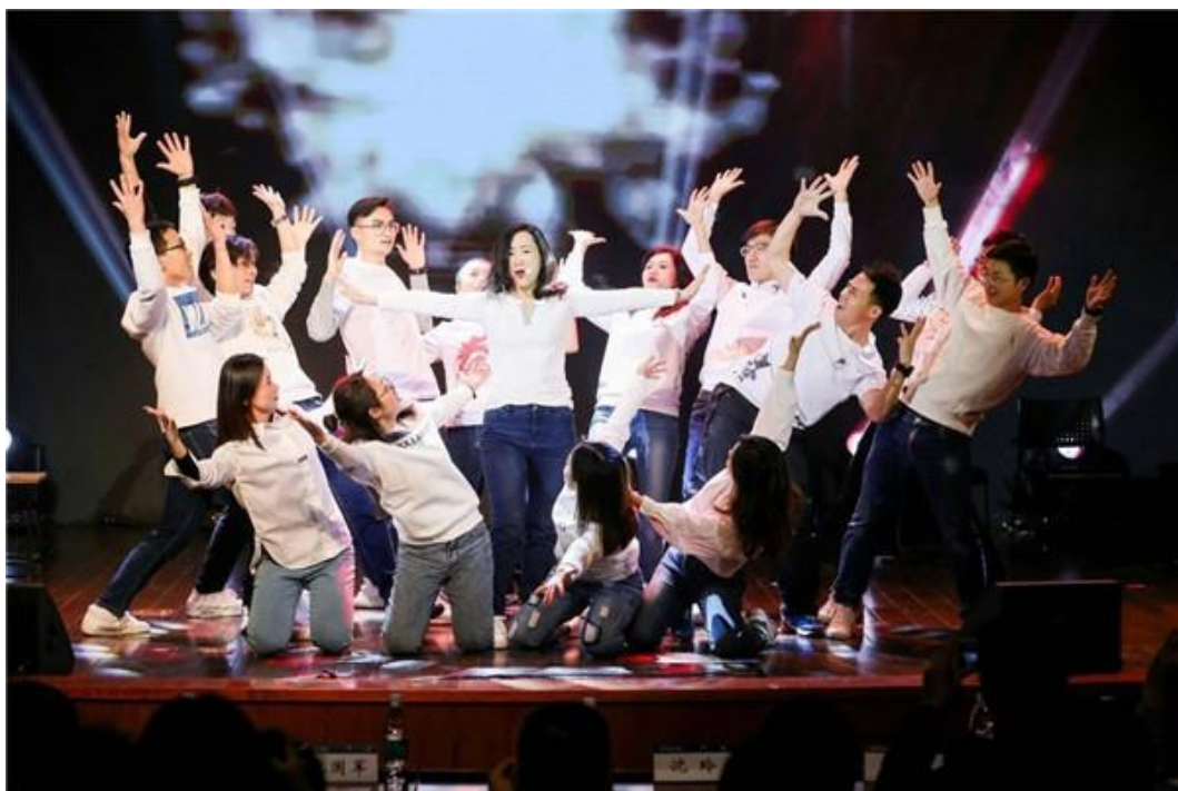
2020 年河海 MBA 迎新慈善年会