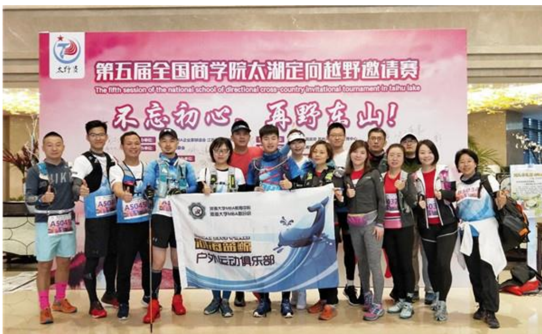
河海 MBAer 参加太野赛