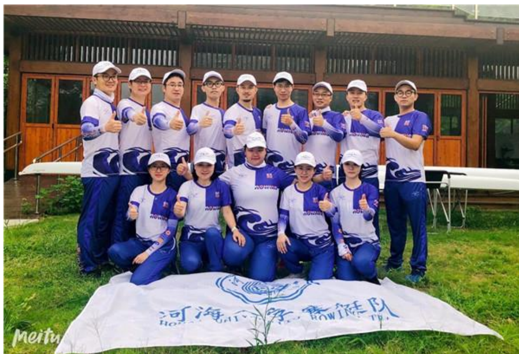
河海 MBA 赛艇队