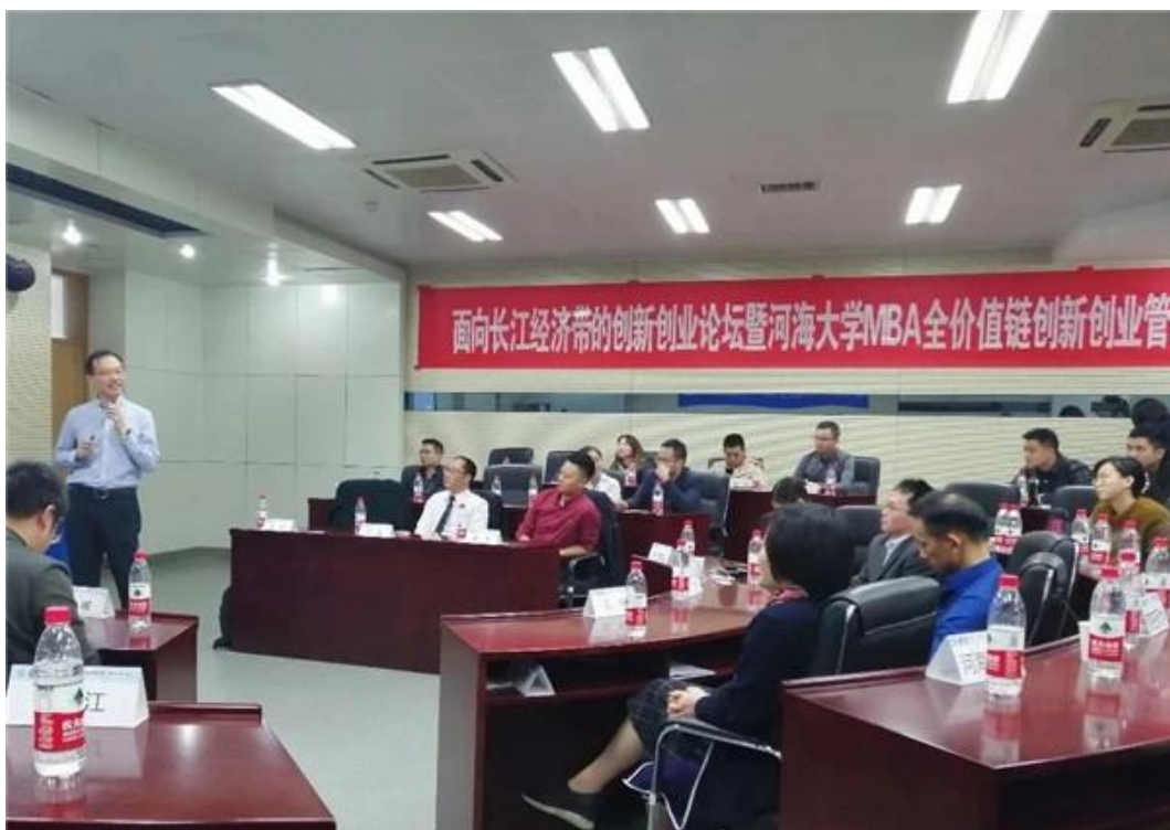
河海 MBA 全价值链创新创业管理论坛