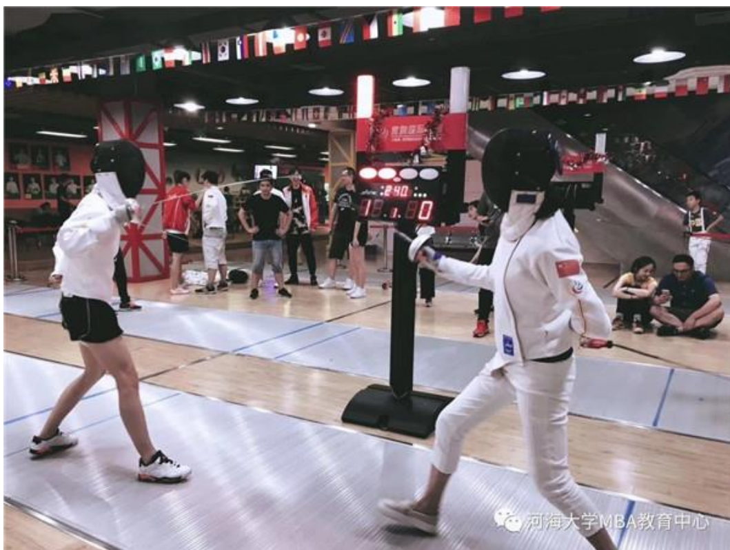
河海 MBA 击剑运动