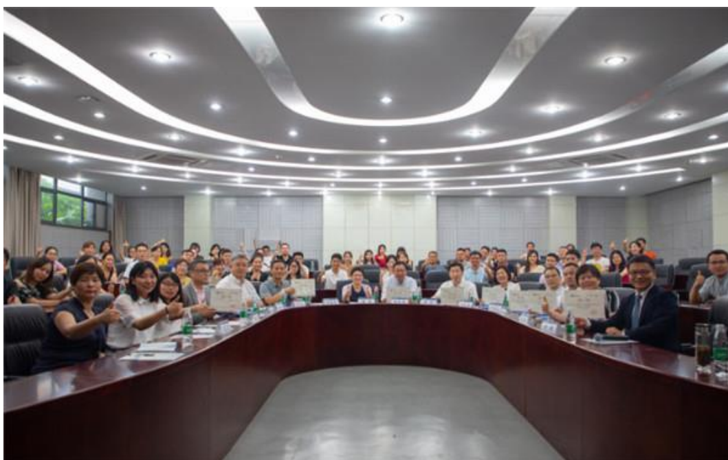
河海 MBA 全职业价值链管理论坛