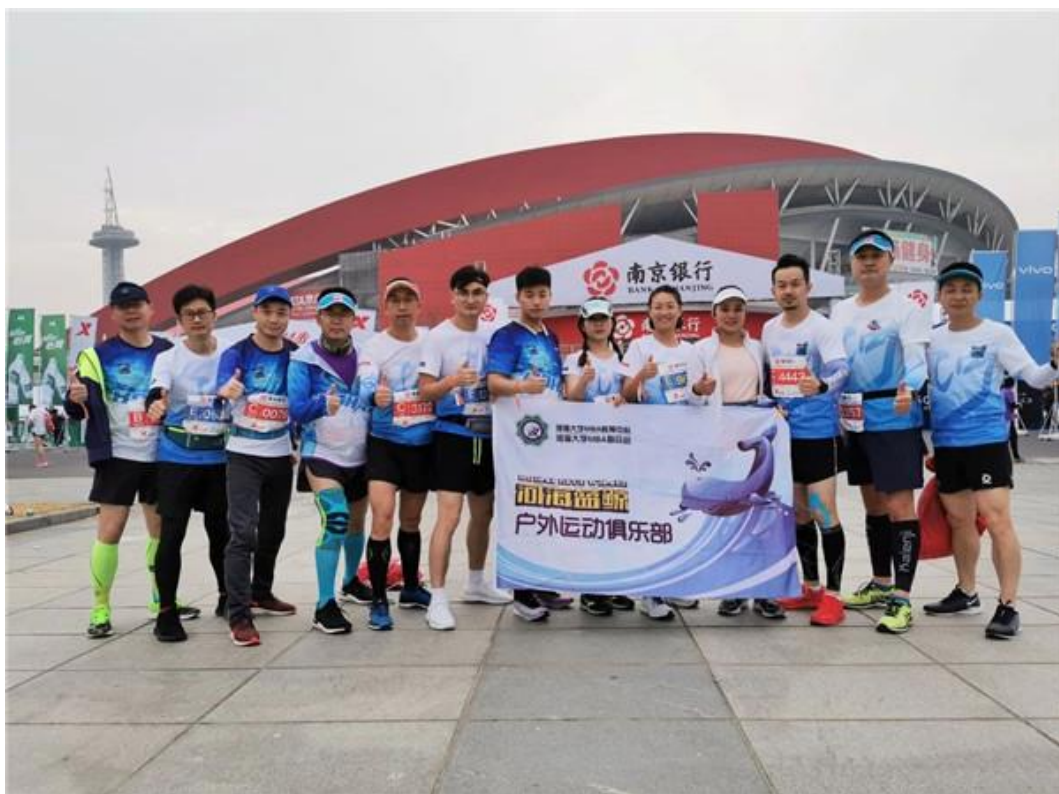
河海 MBAer 参加南京马拉松