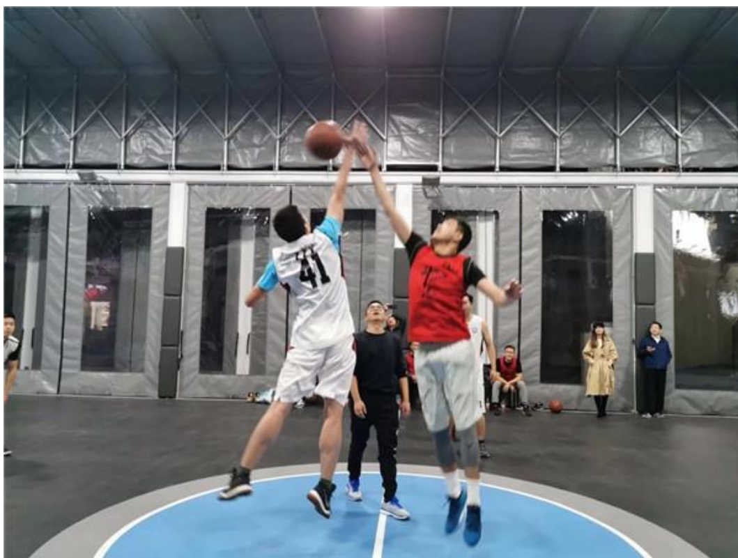
河海 MBA 新生篮球赛